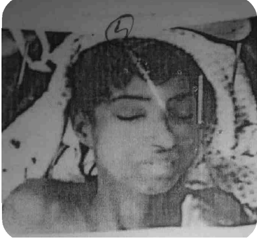
سیریل نمبر 3