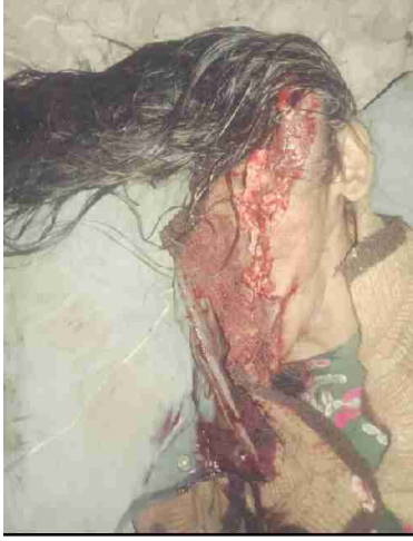
سیریل نمبر 15