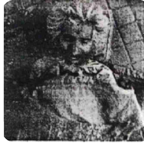
سیریل نمبر 8