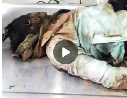
سیریل نمبر 1