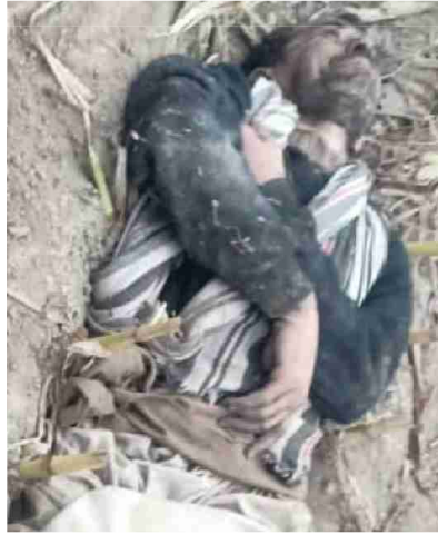
سیریل نمبر 2