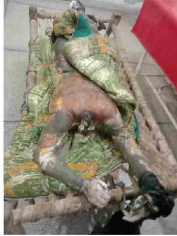
سیریل نمبر 1