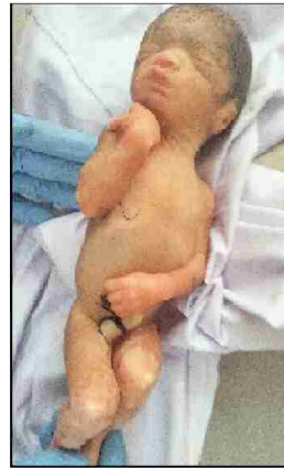
سیریل نمبر 3