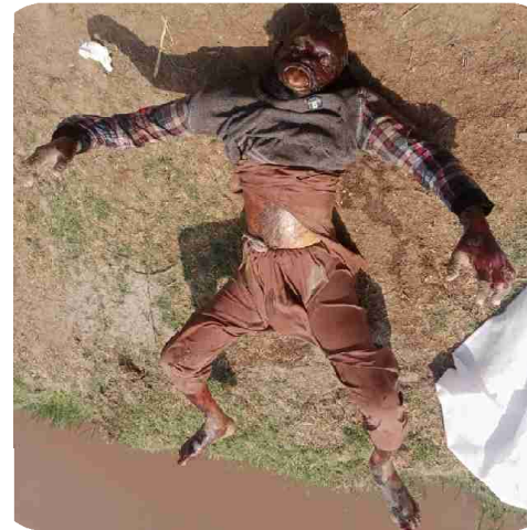
سیریل نمبر 1