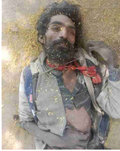
سیریل نمبر 21