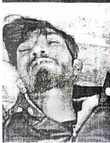
سیریل نمبر 5