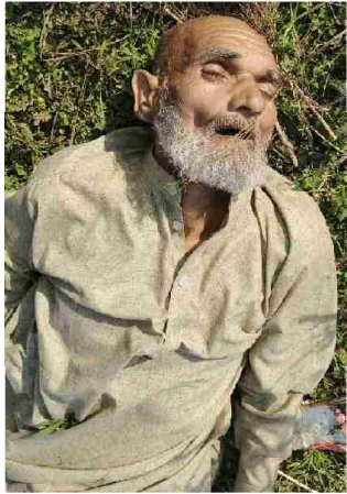
سیریل نمبر 4