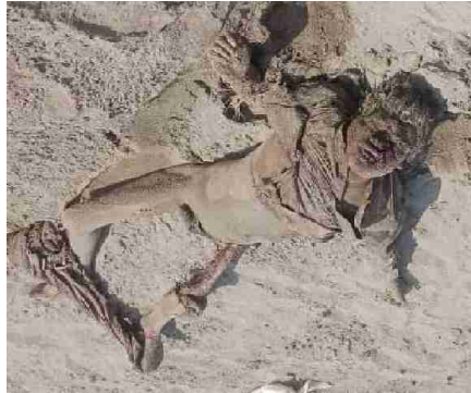
سیریل نمبر 3