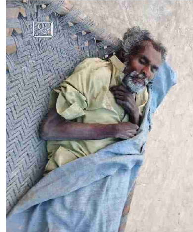
سیریل نمبر 1