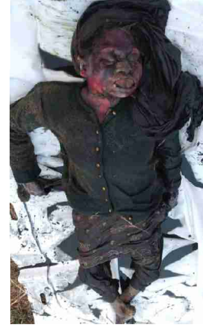
سیریل نمبر 7