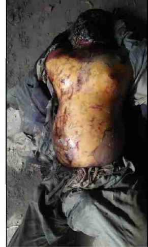
سیریل نمبر 22